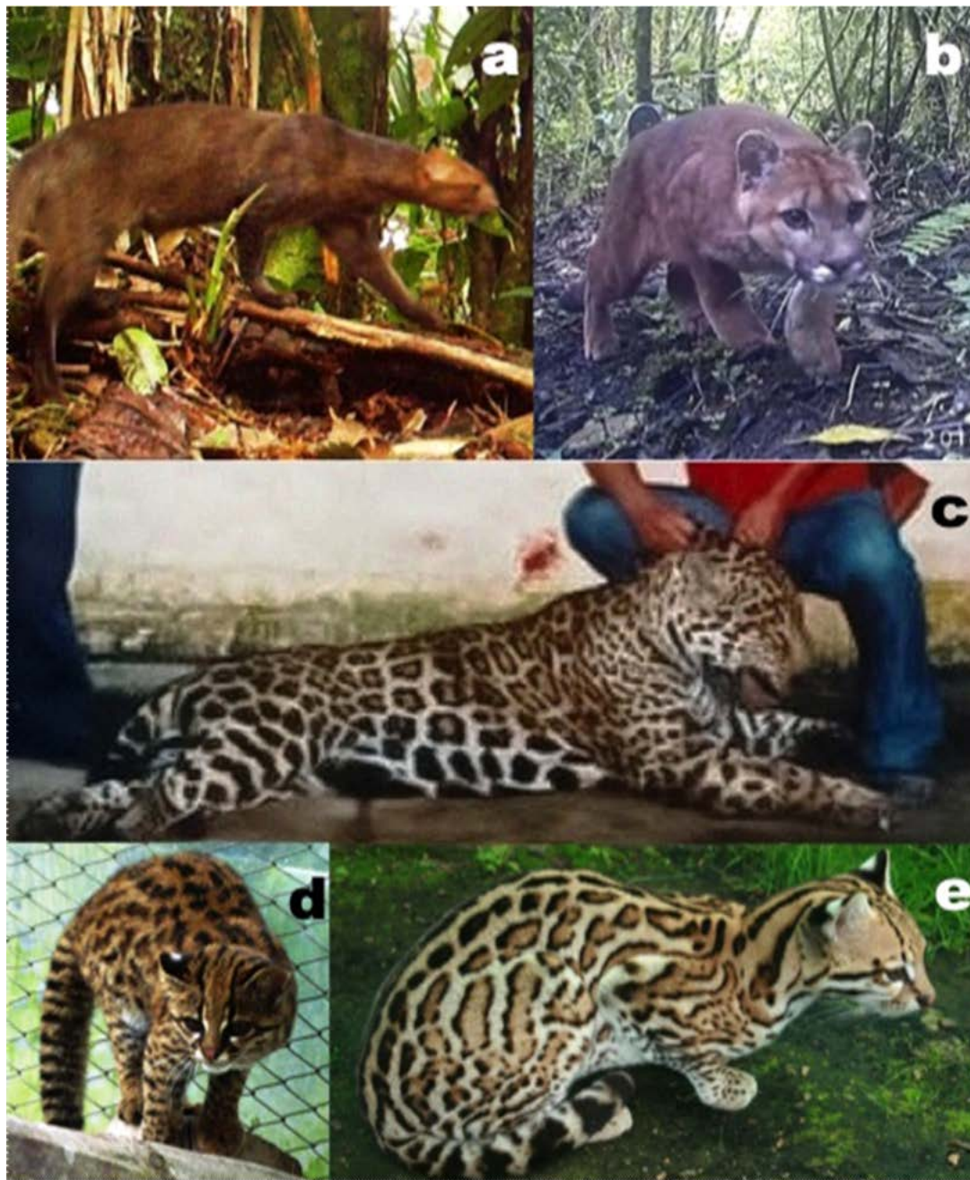
Figura 2. Registros fotográficos de felinos silvestres en el departamento de Caldas-Colombia. (a) Puma yagouaroundi registrado el 11 de enero del 2011, en el municipio de Samaná, corregimiento de Florencia, entre la vereda La Argentina y La Encimada, en el Parque Nacional Natural Selva de Florencia, 1,500 m. (b) individuo juvenil de Puma concolor fotografiado el 13 de mayo del 2014, dentro de la reserva natural Bosques de la CHEC, municipio de Villamaría. (c) Individuo de Panthera onca sacrificado por cazadores en el Resguardo indígena Nuestra Señora Candelaria de la Montaña, vereda El Rosario, municipio de Riosucio. (d) Individuo de Leopardus tigrinus ingresado en Junio de 2010 al Centro de Atención, Valoración y Rehabilitación de Fauna Silvestre (CAV) proveniente del Municipio de Marulanda. (e) Individuo de Leopardus pardalis ingresado al Centro de Atención, Valoración y Rehabilitación de Fauna Silvestre CAV en el año de 2009 proveniente del Río La Miel, municipio de Marquetalia.

la actualidad esta área presenta el mayor número de transvases y represas hidroeléctricas de todo el departamento de Caldas (Lasso-Amézquita et al. 2008; Corpocaldas 2013).